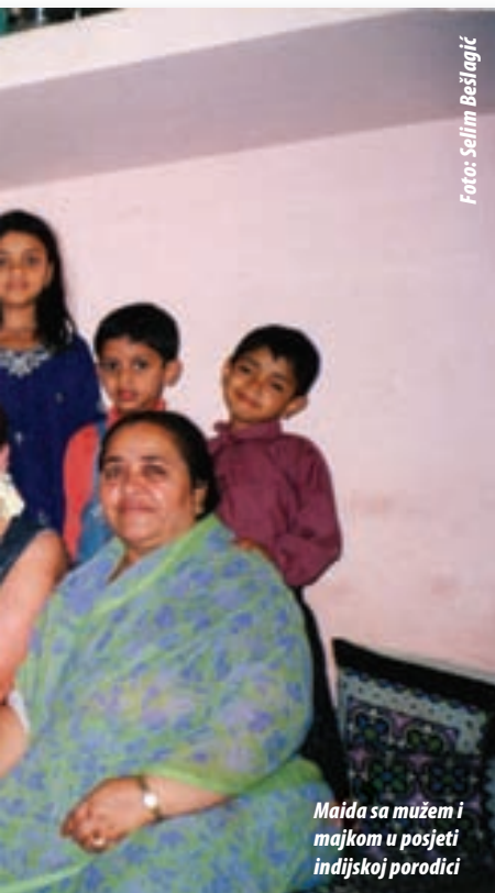
Maida sa mužem i majkom u posjeti indijskoj porodici