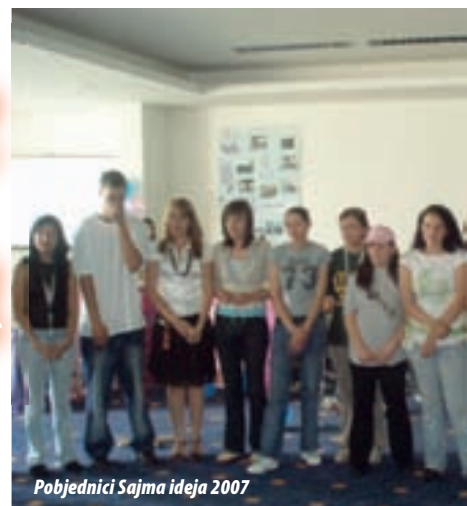
Pobjednici Sajma ideja 2007

Udruženje INFOHOUSE iz Sarajeva je u posljednjih pet godina direktno obučavalo više od 800 mladih u BiH po pitanjima njihovih prava, izgradnje kapaciteta ali i projekt menadžmenta. Tokom seminara primijetili su da mladi, mnogo više nego njihovi profesori ili roditelji, tržišno razmišljaju – ko će me i zbog čega htjeti zaposliti nakon škole neka su od njihovih standardnih pitanja. Međutim, najveća prepreka za njih jeste prvi kontakt sa poslodavcem. Tako da je INFOHOUSE-ov tim 2006. osmislio akciju VOLONTIRAJ-KREDITIRAJ u kojoj mlade spajaju sa potencijalnim poslodavcima. Najveću podršku razvoju ove ideje već dvije godine pruža im GTZ (Njemačko društvo za tehničku saradnju) jer je prepoznalo potencijal za razvoj sveukupnog omladinskog sektora u BiH - Poenta ovog projekta kojeg želimo