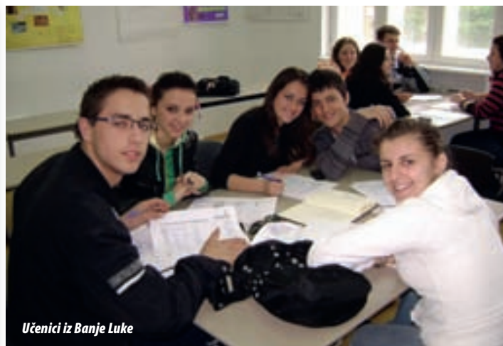
Učenici iz Banje Luke